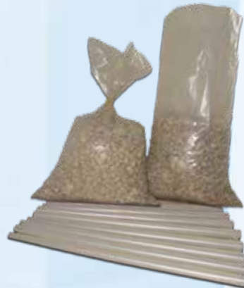
Säcke und Beutel